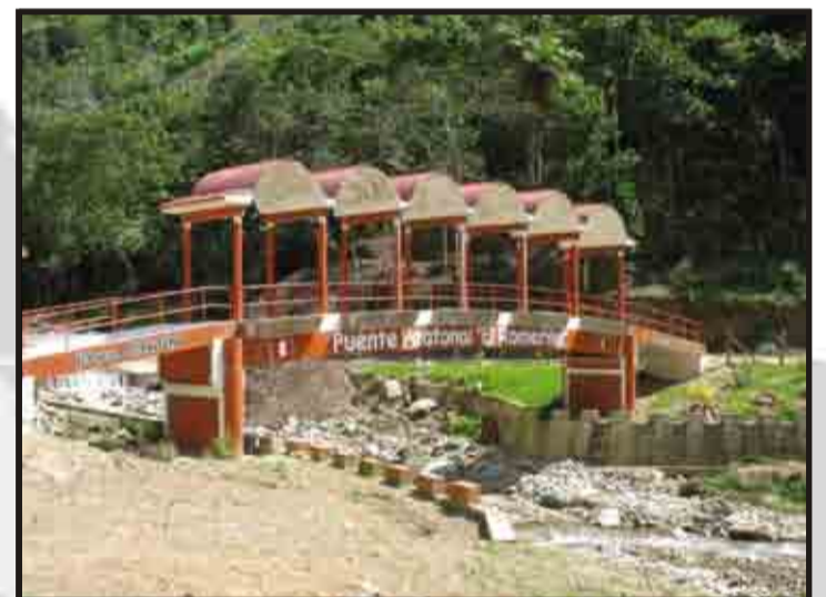
Puente peatonal 'El Romerillo'