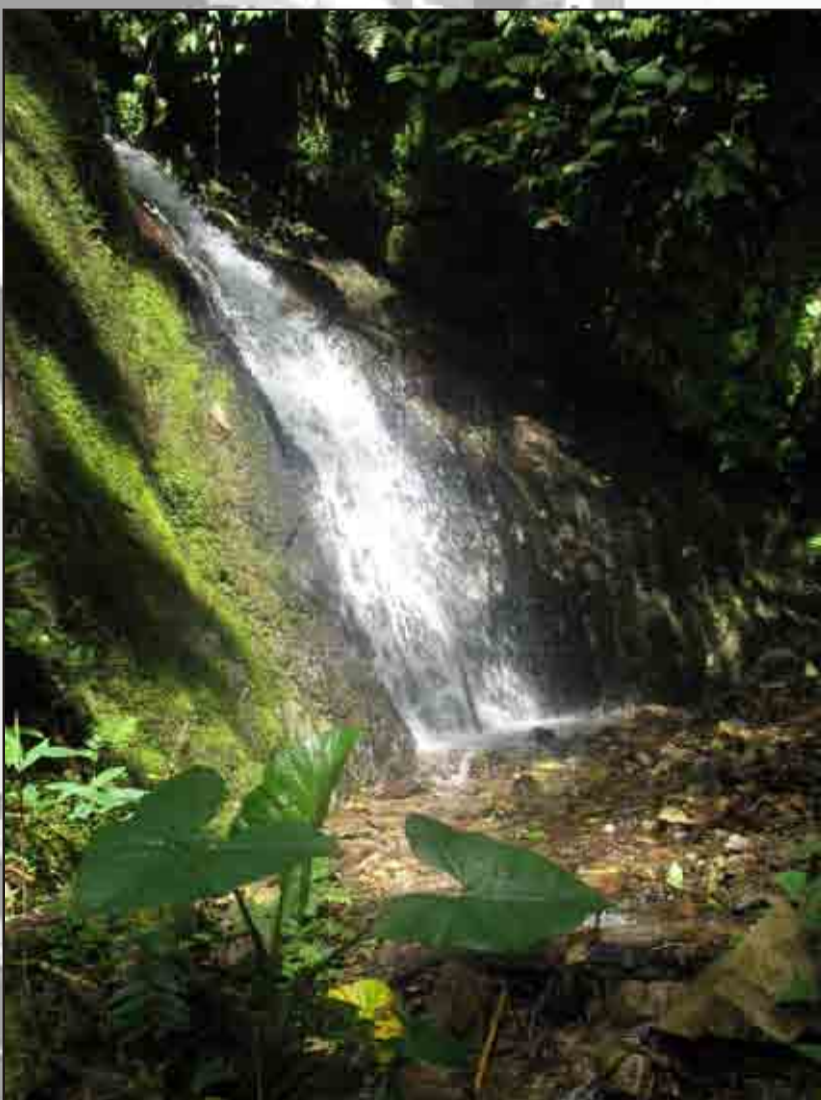
Catarata en el bosque Chinchiquilla

Desde San Ignacio es posible visitar el bosque Chinchiquilla en un día. El caserío Nueve de Octubre se ubica en el camino de San Ignacio a Chirinos, a veinte kilómetros (una hora) de la ciudad. A una hora y media caminando del caserío se puede visitar el bosque de neblina por un recorrido ecoturístico, acompañado por un guía. Se puede apreciar el bosque mismo, con su fauna diversa, cataratas y vistas hermosas sobre la región (ej. la ciudad de San Ignacio o el Santuario Nacional Tabaconas Namballe). También es un área muy interesante para aviturismo, con la presencia del emblemático gallito de las rocas.