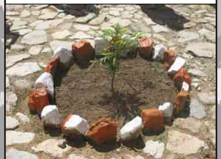
Romerillo en el parque