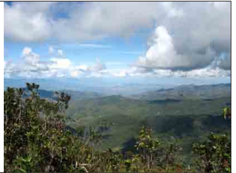
Vista desde el cerro Chinchiquilla

En el distrito de San Ignacio, cerca de 85 % de las áreas boscosas fueron destruidos por uso de agricultura migratoria. Unas de las pocas áreas boscosas que aún se encuentra ahí es el Bosque Chinchiquilla, alrededor del cerro del mismo nombre, el punto mas alto de la región (2720 msnm).