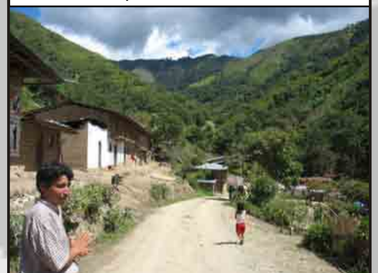
El Caserío Nueve de Octubre